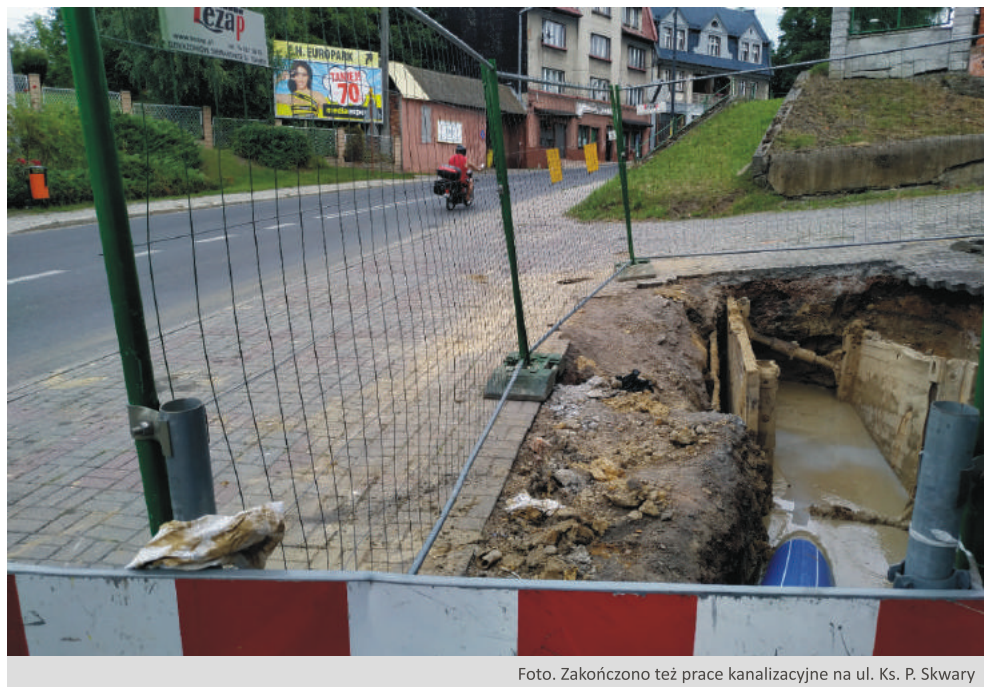
Foto. Zakończono też prace kanalizacyjne na ul. Ks. P. Skwary

Drugi etap prac na ul. Lipowej obejmuje krótki odcinek 153 m. Jego zadaniem jest poprawa parametrów technicznych drogi. Wykonawcą jest Przedsiębiorstwo Usługowo-Produkcyjne Alkor z Wodzisławia Śl. Prace zakończą się w październiku. Wartość zadania to ponad 124 tys. zł.