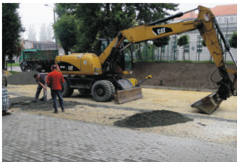
Przy SP 1 utwardzono plac, na którym będą m.in. realizowane zawody streetball.

- Od września w naszej szkole po raz pierwszy będą uczyć się klasy siódme, a za rok także ósme, dlatego musimy