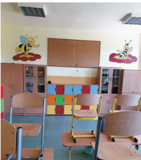
W SP 4 w malowaniu klas lekcyjnych pomagali pracownicy ZGKiM z Pszowa.

W tej szkole pomalowane zostały klasy lekcyjne. Wymieniono drzwi do szatni oraz płytki na schodach wejściowych. Ponadto wykonano szereg działań ogrodowych. Wszystkie prace wykonali pracownicy ZGKiM w Pszowie.