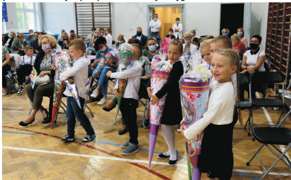
Mniej uroczyste, ale również pełne uśmiechów było rozpoczęcie roku w pszowskich szkołach.

I zaczęło się. Po półrocznej przerwie uczniowie wrócili do szkół. Rozpoczął się nowy rok szkolny. Wyjątkowy, bo pełen zaostrzonych przepisów sanitarnych, rygorów i zasad.