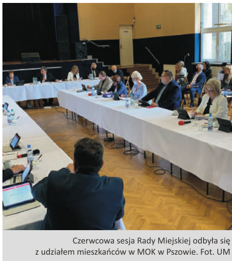
Czerwcowa sesja Rady Miejskiej odbyła się z udziałem mieszkańców w MOK w Pszowie.

w Rydułtowach i Wodzisławiu Śląskim wyniosła 13 tys. zł. Za tę kwotę zakupiono sterylizator i przenośny aparat rentgenowski dla oddziału pediatrycznego.