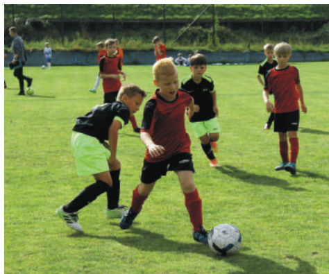
foto: Młodzi piłkarze trenujący w Akademii Piłkarskiej United w przyszłości też mogą osiągać duże sukcesy.