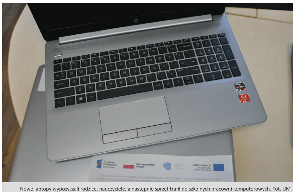
Nowe laptopy wypożyczyli rodzice, nauczyciele, a następnie sprzęt trafił do szkolnych pracowników komputerowych.

Laptopy trafiły do szkół podstawowych, a następnie zostały wypożyczone uczniom i nauczycielom, którzy mieli największy problem z prowadzeniem nauki w systemie zdalnym. Pobierając sprzęt obie strony podpisują odpowiednią umowę.