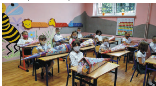
Mniej uroczyste, ale również pełne uśmiechów było rozpoczęcie roku w pszowskich szkołach.

Wszystkim uczestnikom szkolnych społeczności życzymy wytrwałości w nauce i pracy, troski o wspólne dobro, otwarcia na potrzeby drugiego człowieka i przede wszystkim dużo zdrowia.