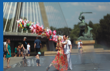
Tango w fontannie