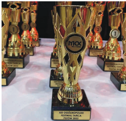
XIII Ogólnopolski Festiwal Tańca - Pszów 2022.

Setki młodych, kolorowo ubranych ludzi na każdym kroku, uśmiech zabawa i taniec – tak wyglądała majowa sobota (14.05) w centrum Pszowa. Do miasta przyjechało niemal 1,5 tys. ludzi z całej Polski na XIII Ogólnopolski Festiwal Tańca.