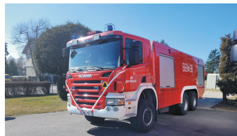
Nowa Scania to samochód, w którym mieści się 8 tys. l wody.

Starali się o nią od roku i wreszcie się udało. Strażacy z OSP w Krzyżkowicach cieszą się Scanią, którą kupili m.in. dzięki miejskiej dotacji i sprzedaży jednego z samochodów w jednostce.