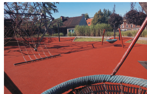
Dwaj wandale postanowili zniszczyć huśtawkę i nawierzchnię.

Zniszczona huśtawka typu bocianie gniazdo, uszkodzona nawierzchnia – wandale nie oszczędzili placu zabaw w Parku Jordanowskim w Pszowie. Na szczęście zostali w porę złapani przez policję i ukarani.