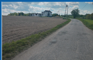
Drogi do remontu