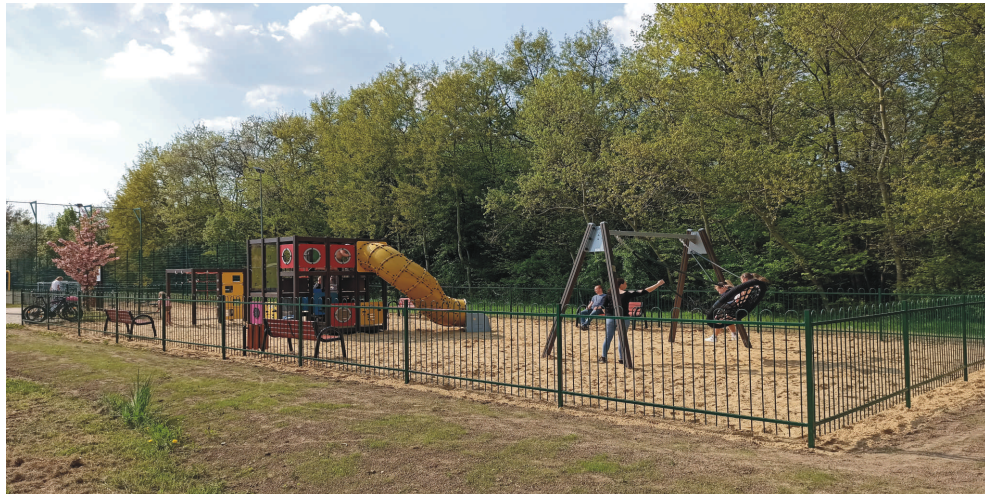
Atrakcje dla najmłodszych i tych starszych przygotowano przy ul. Kraszewskiego, niedaleko Orlika.

Dwa nowe place zabaw powstały w Pszowie tej wiosny. Pierwszy znajduje się tuż obok strażnicy w Krzyżkowicach (przy ul. Kolberga), drugi natomiast w bezpośrednim sąsiedztwie pszowskiego Orlika (przy ul. Kraszewskiego). To jednak nie jedyne miejsca codziennej rekreacji mieszkańców.