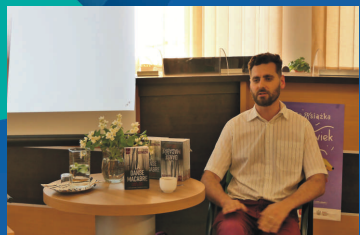
Kryminał promuje gwarę