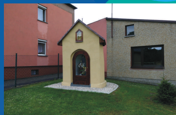
Kapliczka w Krzyżkowicach